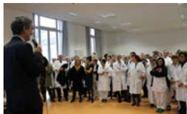
Ospedale Fatebenefratelli e Oftalmico

Incontri di presentazione della nuova Direzione Strategica