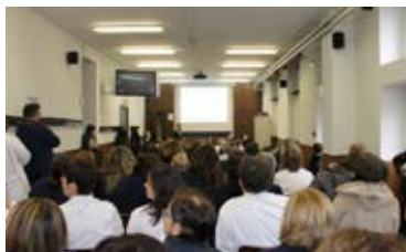
Ospedale Macedonio Melloni