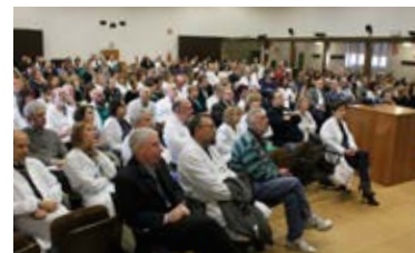
Ospedale Luigi Sacco - Polo Universitario